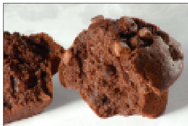
Dubbele chocolade muffins