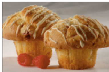
Muffins met frambozen en witte chocolade