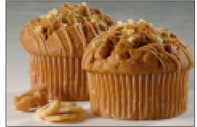
Muffins met karamel en banaan