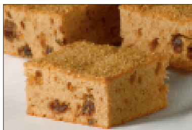
Plaatcake met appel, kaneel en dadels