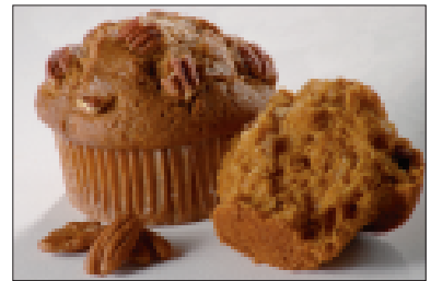
Muffins met karamel, pecannoten en kandjijsiroop