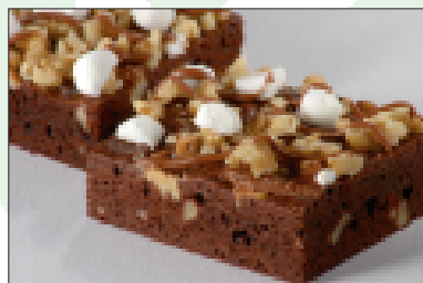
Rocky Road brownies