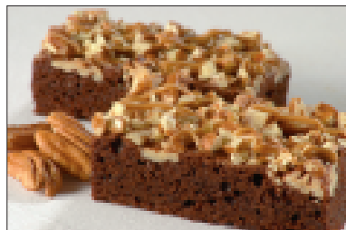
Brownies met karamel en pecannoten