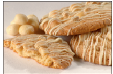
Cookies met witte chocolade en macadamianoten