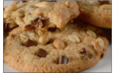
Cookies met chocoladeschilfers en pinda's