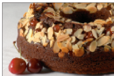
Ringcake met kersen en amandelen