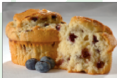
Muffins met bosbessen