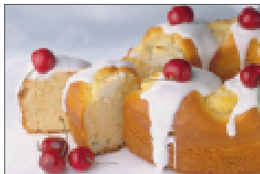
Ringcake met verse kaas en eieren