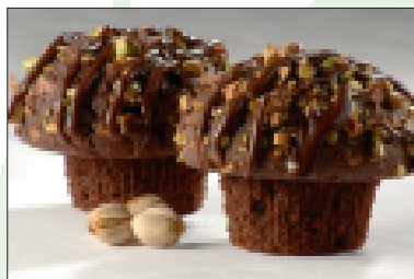
Muffins met chocolade en pistachenoten