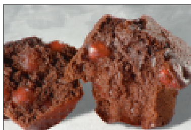
Muffins met chocolade en kersen