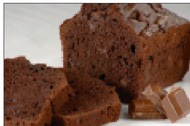
Cake met Belgische chocolade