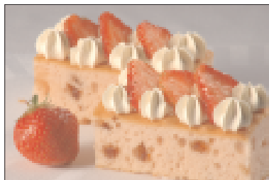
Aardbeigebak met slagroom