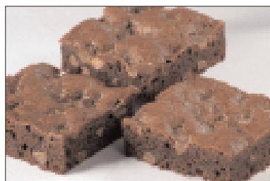
Brownies met chocoladestukjes