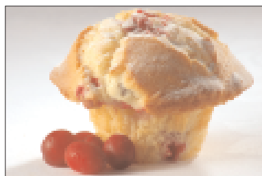
Muffins met veenbessen