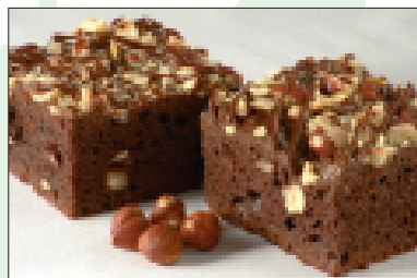
Plaatcake met chocolade en hazelnoten