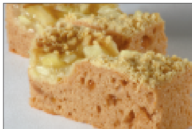
Plaatcake met appel en streuzel