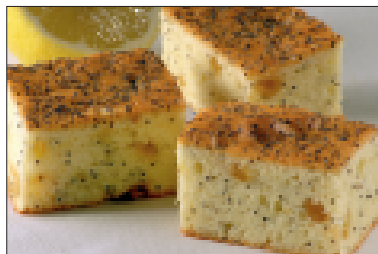
Citroen- maanzaad plaatcake